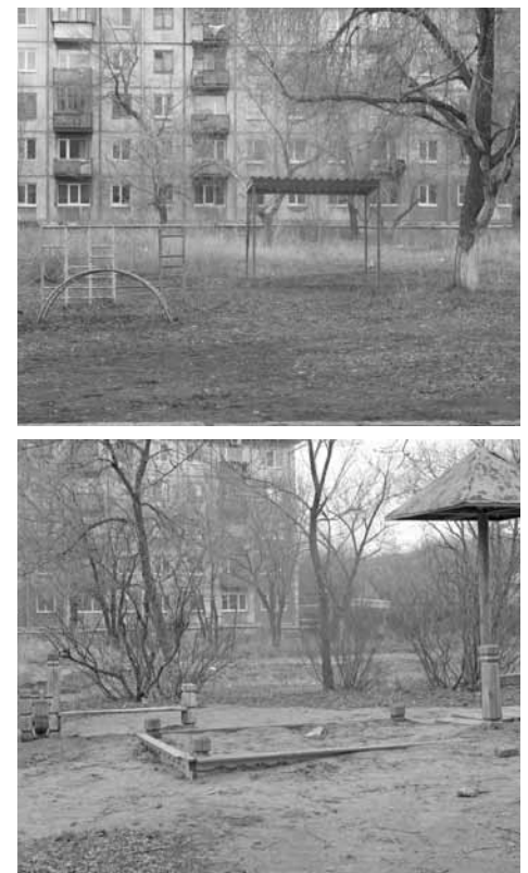
Начало. Продолжение на стр.8

1. Визуализированное изображение существующего положения дворовой территории многоквартирного жилого дома дом № 10 по ул.Советская