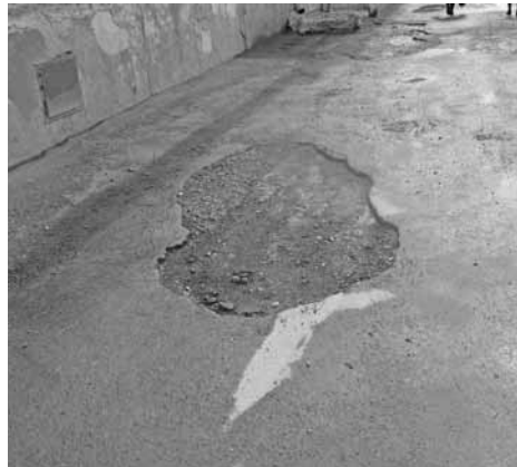
2. Описание работ и мероприятий, предлагаемых к выполнению благоустройству дворовой территории многоквартирного жилого дома №10 по ул.Советская